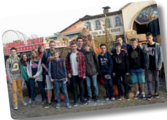
Jeugduitstap naar Bobbejaanland